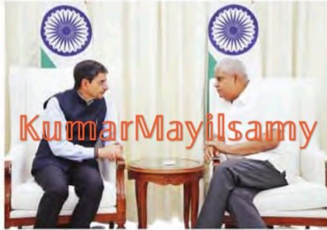
தில்லியில் குடியரசு துணைத் தலைவர் மாளிகையில் குடியரசுத் துணைத் தலைவர் ஜக்தீப் தன்கரை புதன்கிழமை சந்தித்துப் பேசிய தமிழக ஆளுநர் ஆர்.என்.ரவி.

கடந்த ஆண்டு ஆகஸ்டில் குடியரசு துணைத் தலைவராக தன்கர் தேர்வு செய்யப்பட்ட போதும்,