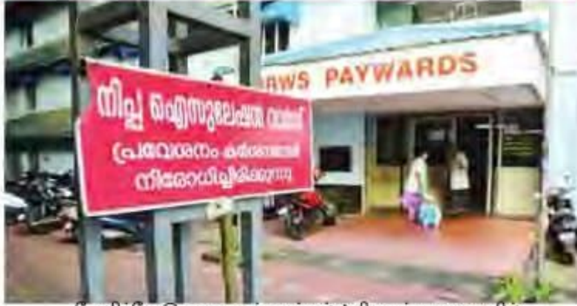
கோழிக்கோடு அரசு மருத்துவக் கல்லூரி மருத்துவமனையில் அமைக்கப்பட்டுள்ள நிபா தனிமை வார்டு.

நகரில் கட்டுப்பாட்டு மையம் அமைக்கப்பட்டு முன்னெச்சரிக்கை நடவடிக்கைகள் ஒருங்கிணைக்கப்பட்டு வருகின்றன.